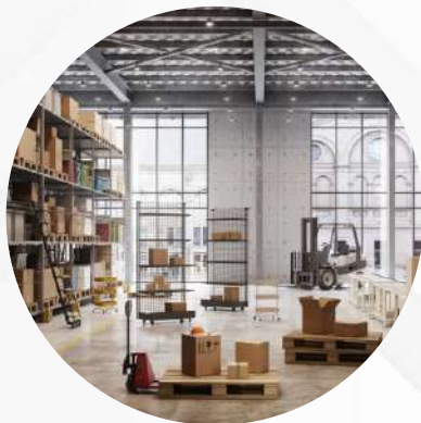
Fábrica y local