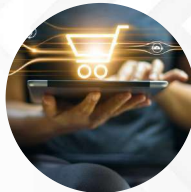
Mercancía y su dinero