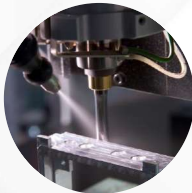
Maquinaria y equipos