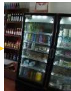
Orden y aseo