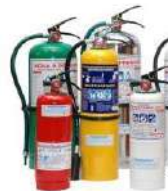
Protecciones contra incendio