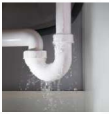
Rotura de tubería