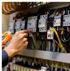
Daños internos de maquinaria y equipos