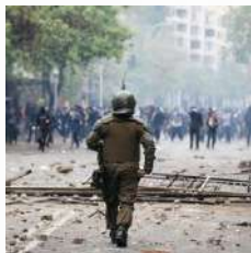
Actos malintencionados de terceros