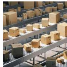
Movilización de mercancías