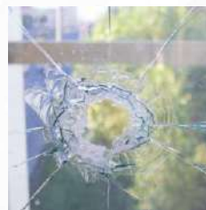
Daños a terceros