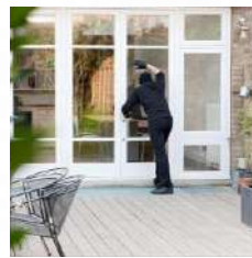
Robo de bienes