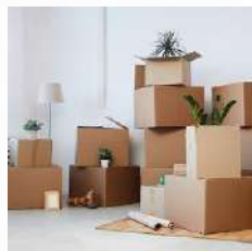
Gastos de arriendo y mudanza