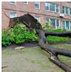
Caída de objetos externos