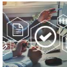
Directores y administrador